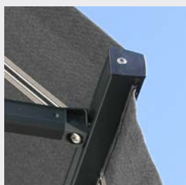
Standard frontprofil med kapp.